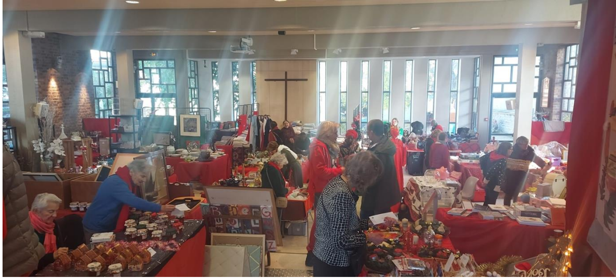
Tous Ensemble pour la Vente