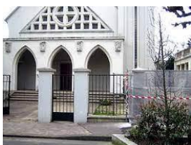
Eglise luthérienne Courbevoie

Argenteuil Asnières Bois-Colombes Colombes Courbevoie La Garenne-Colombes Gennevilliers