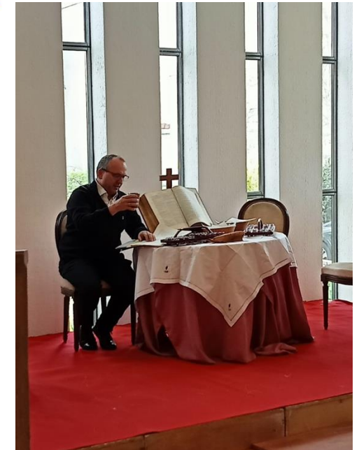
Sainte scène à Nohan