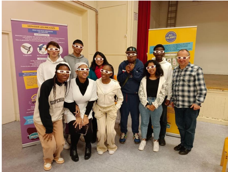
Groupe des jeunes – février 2024 Exposition « Deviens un héros » pour lutter contre les préjugés