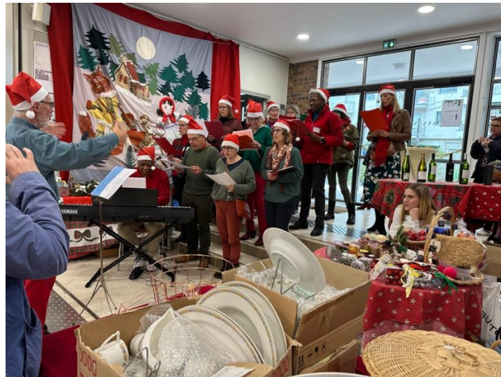
Les chanteurs « Chantons ensemble »