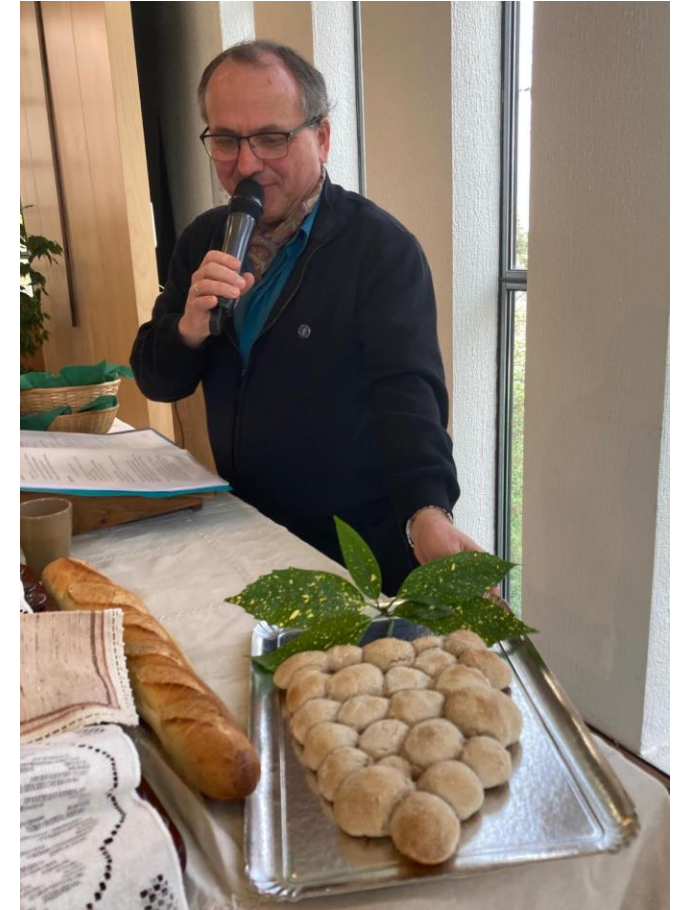
Rameaux 2024 Pain préparé par les enfants

Centre 72, 72 rue Victor Hugo à Bois-Colombes