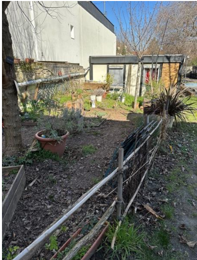
Les pouces verts