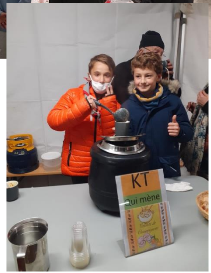
Fête de la soupe